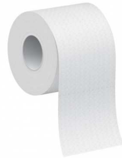
ROLLO HIGIENICO DOMESTICO PAQUETE 12 UNIDADES: 2,79€ IVA INCLUIDO