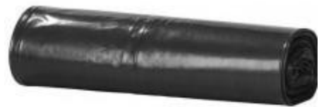
ROLLO BASURA 85X105 COMUNIDAD: 1,05€ + IVA

REPARTO A DOMICILIO GRATUITO A PARTIR DE 70€ CONSULTE NUESTRA AMPLIA GAMA DE PRODUCTOS PARA LA LIMPIEZA Y DESINFECCION (TF: 96 334 49 62) PRECIOS VALIDOS HASTA AGOTAR EXISTENCIAS Email: crisberlin@crisberlin.com