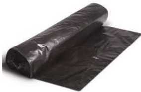
ROLLO BASURA 52X58 DOMESTICA (25 SERV.): 0,68€ + IVA