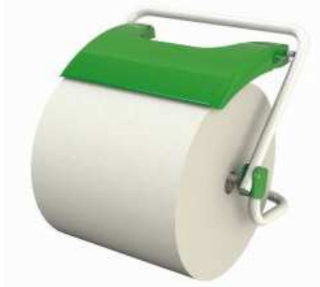
BOBINA TRAPICEL (soporte no incluido): 9 € + IVA