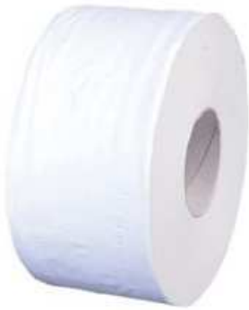
ROLLO HIGIENICO INDUSTRIAL PAQUETE 18 UNIDADES: 18€ + IVA