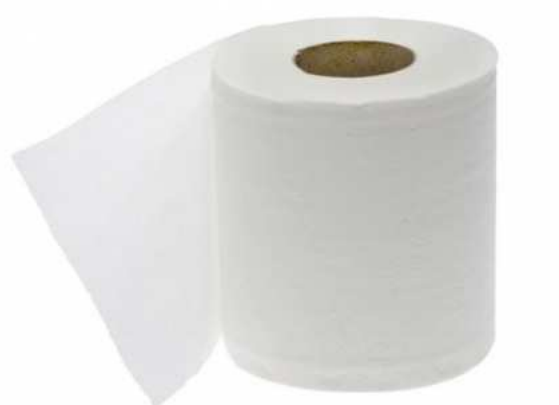
ROLLO CHEMINE: 2,30€ + IVA